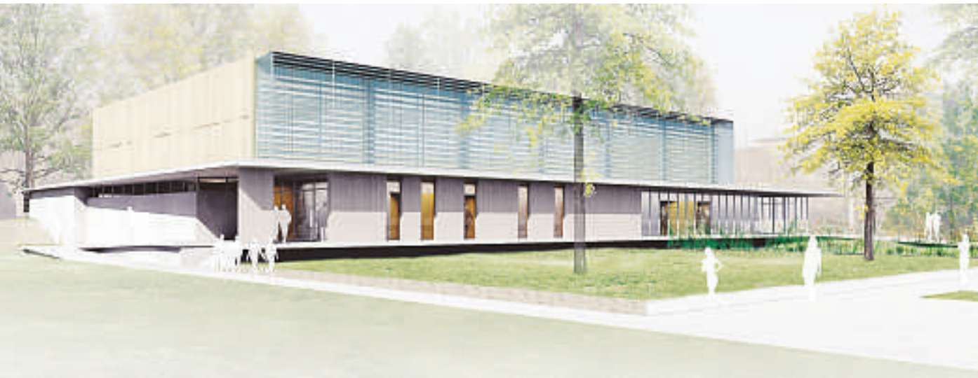
Le gymnase du Heyritz présentera en façade sud un « mur solaire ». (Document remis)

■ A proximité du collège Louis-Pasteur se profile une voie destinée à desservir deux nouvelles constructions sportives projetées au Heyritz.