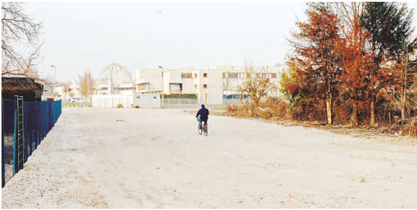
Du côté du collège Louis-Pasteur, une voirie restructurée pour desservir les nouveaux équipements sportifs.

De la route de l'Hôpital à la rue de la Plaine-des-Bouchers, une vingtaine d'hectares en bonne partie préservés de l'urbanisation. Tout près du centre-ville, une vacuité propice à une invasion de l'automobile (côté Centre administratif au parking du personnel en travaux, les voitures encombrant le chemin du Heyritz) et au développement d'un habitat de fortune (les Enfants de Don Quichotte campent près de l'eau).